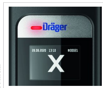
Символ «Алкоголь не обнаружен»