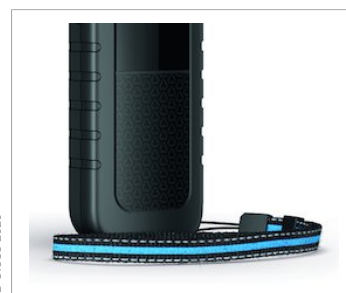
Комплект отражающей пленки: желтой или оранжевой (опция)