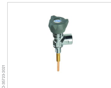
Вентиль с ограничением потока