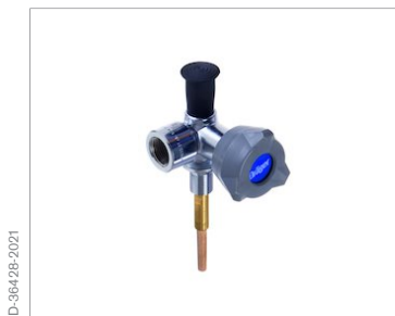
Угловой вентиль с ограничением потока