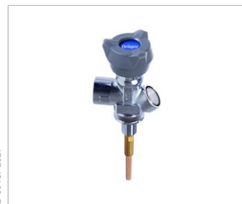
Вентиль с ограничением потока и индикатором